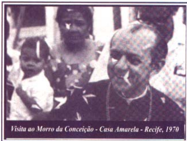
Visita ao Morro da Conceição - Casa Amarela - Recife, 1970