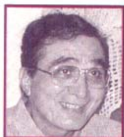
Frei Aloísio Fragoso